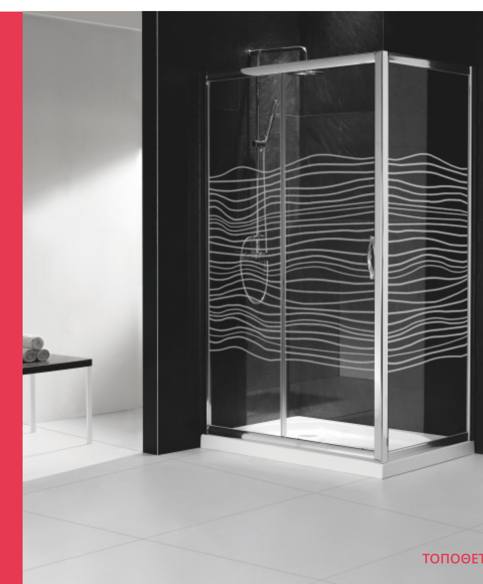
ΤΟΠΟΘΕΤΗΣΗ ΣΕ ΓΩΝΙΑ ΤΟΙΧΟΥ

Καμπίνα με γυαλί ασφαλείας (tempered) 6mm, διάφανο σεριγραφάτο με χρωμέ πλαίσιο. Μπροστινό συρόμενο και πλαίσιο σταθερό. Δυνατότητα αναστροφής.