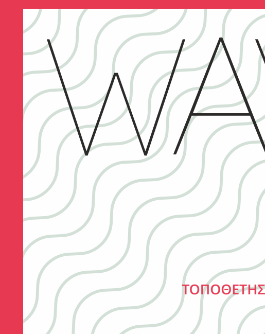
ΤΟΠΟΘΕΤΗΣΗ ΑΠΟ ΤΟΙΧΟ ΣΕ ΤΟΙΧΟ

Διαστάσεις συρόμενου 170, 160, 150, 140, 120, 100 x 185(Y) Διαστάσεις σταθερού 90, 80, 70 x 185(Y)